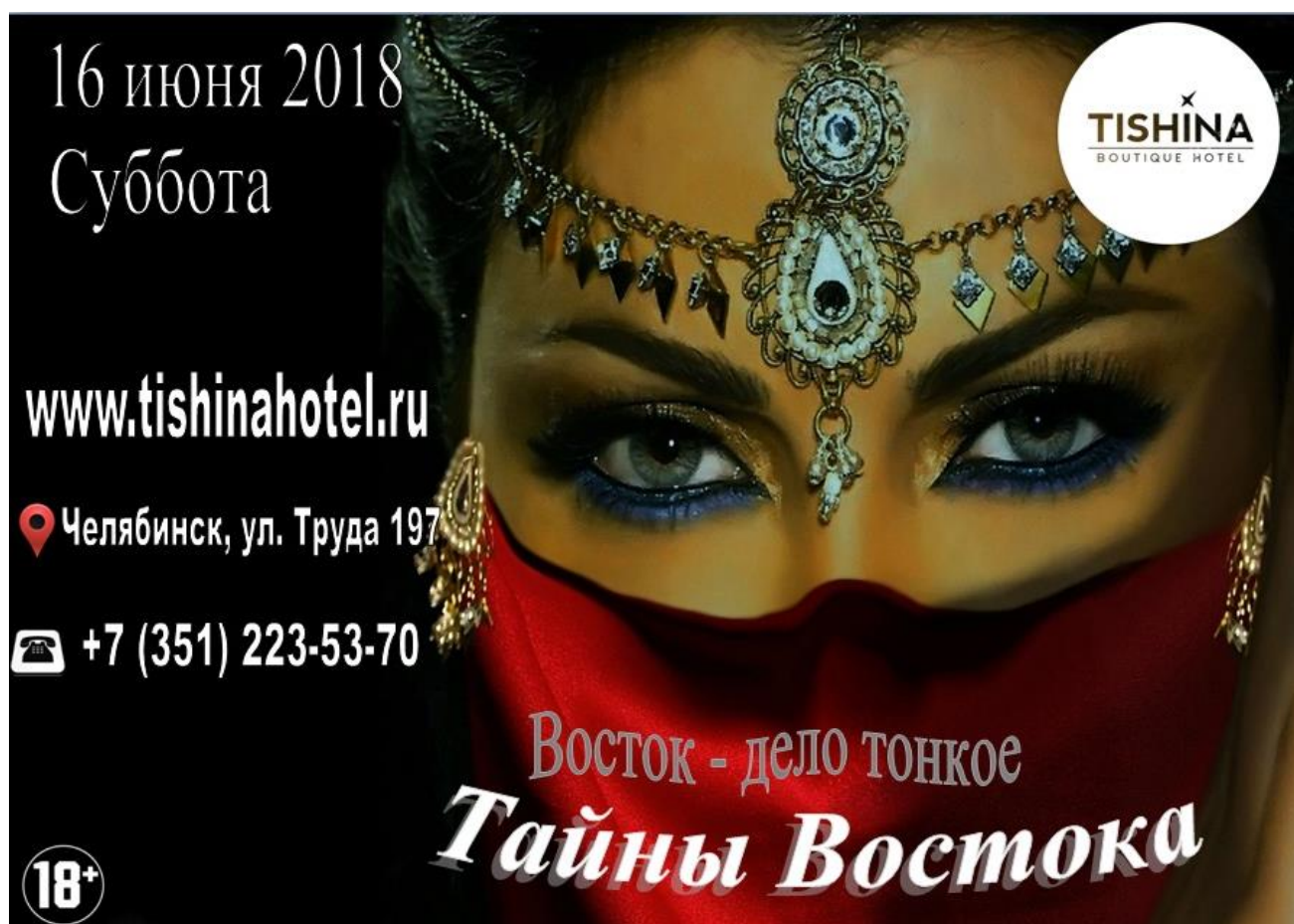
Рисунок А. 1 – Реклама анимационной программы